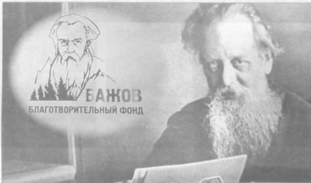
Бажов, где родился великий писатель Бажов" "Прооб- Папа слушал и вышты-